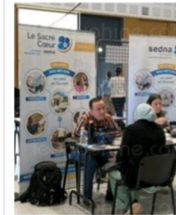
La résidence du Sacré-Cœur, comme les autres entreprises présentes, a réceptionné nombre de curriculum vitae (CV).

À quelques semaines de la saison estivale, les emplois saisonniers étaient d'actualité. ■